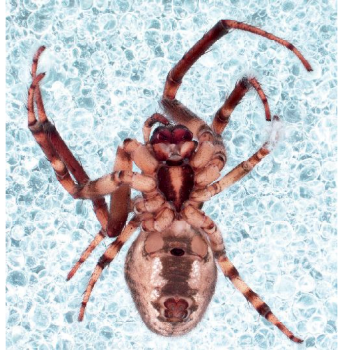
Figure 3. - Zygiella x-notata (ref. GC2), en vue ventrale (grossissement x0,9).

connue dans le sud-ouest de l'océan Indien. Elle n'est pas connue des Seychelles, pourtant bien étudiées (SAARISTO, 2010).