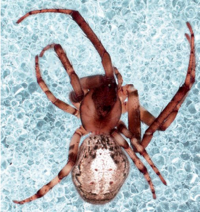
Figure 2. - Zygiella x-notata (ref. GC2), en vue dorsale (grossissement x0,9).